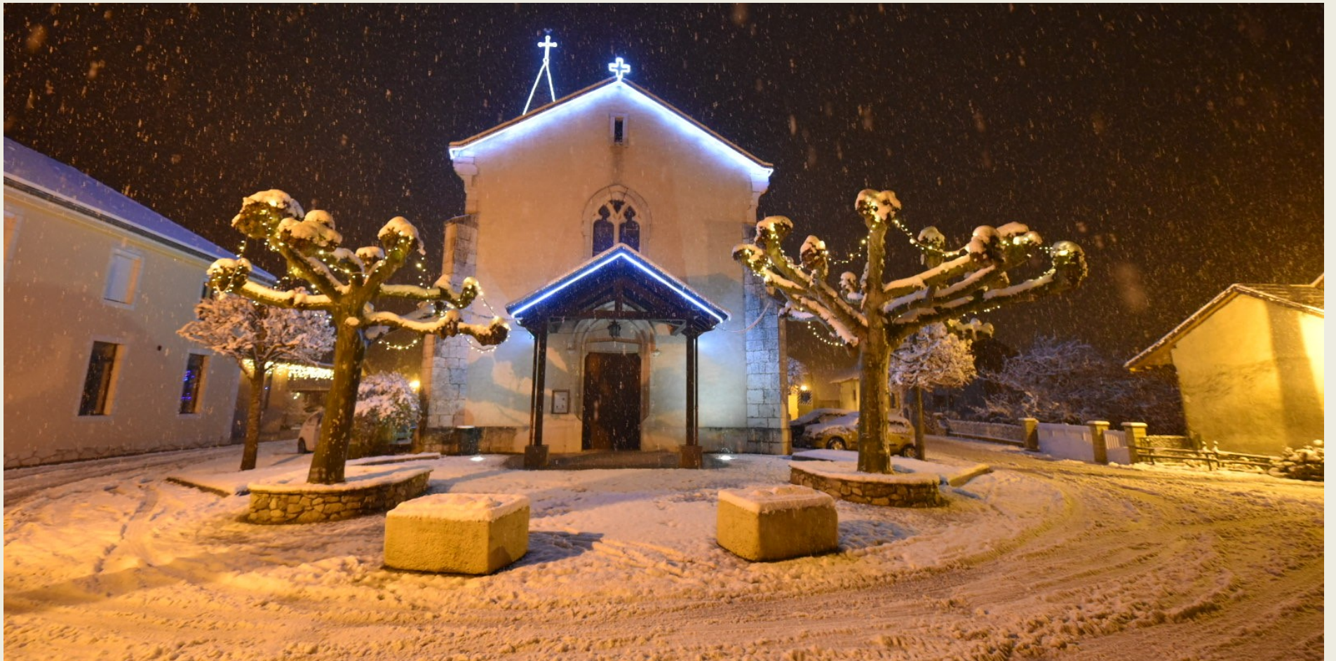
Un mois de décembre 2020 enneigé à Musièges

AU CROISEMENT DU PAYS GENEVOIS, ENTRE USSES ET FORNANT